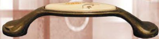
UC04 - MLK2 PorcelanaMosidz