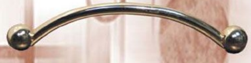
GAUN - 12 Chrom