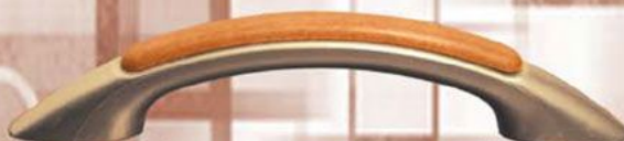
Łuk 2 - Satyna Orzech