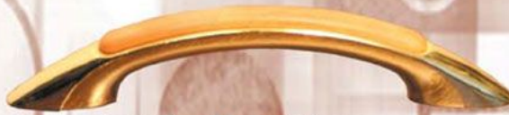
Łuk 2 - Złoto Olcha