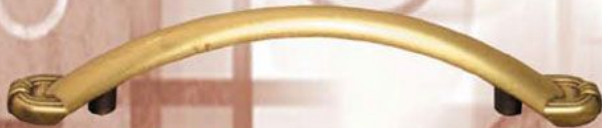
UG - 3205/96 Mosiądz Patyna