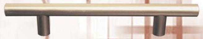
Reling - Satyna