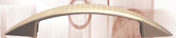
KARO Biplast - Satyna