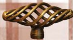
US - P10062/04 Stare Złoto