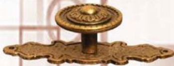
WP - Stare Złoto Patyna