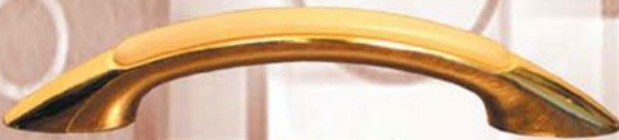
Łuk 2 - Złoto Buk