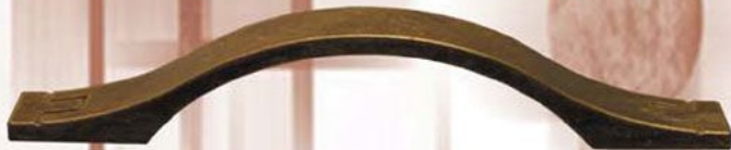
U - 59 Zoto Patyna