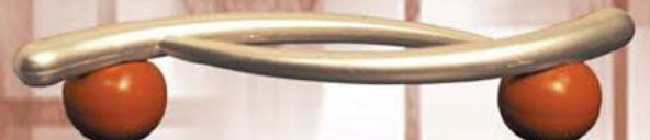
Precelek - Satyna Calvados